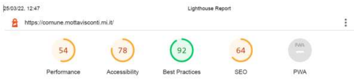
Figura 1 - Risultato del test di accessibilità effettuato sulla home page

I test automatici effettuati hanno dimostrato che il sito istituzionale è rispondente mediamente al 78% dei requisiti di accessibilità.